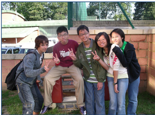
L'estada és una gran oportunitat per conèixer altres cultures

Des de fa cinc anys, el Guildford College és una de les bases de les Estades Aprèn a la Gran Bretanya i destaca per ser un College que té tota una secció destinada durant tot l'any a l'ensenyament de l'anglès per a alumnes estrangers. Així, al Guildford College és normal coincidir en una mateixa classe amb alumnes que estudien per preparar-se per la prova d'anglès d'accés a la Universitat Anglesa. Estudiants coreans, xinesos, russos, danesos, japonesos,